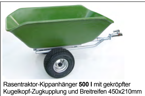
Rasentraktor-Kippanhänger 500 l mit gekröpfter Kugelpf-Zugkupplung und Breitreifen 450x210mm