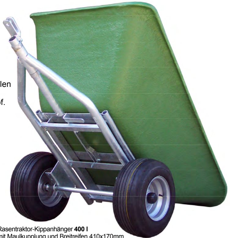
Rasentraktor-Kippanhänger 400 l mit Maulkupplung und Breitreifen 410x170mm

Die Anhänger dienen zum Transport von Sand und Erde, Gartengeräten, Gras, Strauchwerk, Gartenabfällen und anderen Materialien auf Privatgrundstücken. Max. Geschwindigkeit 20 km/h. Ideal für Haus und Hof. Auch zum Ausmisten von Ställen und Abmisten von Pferdeweiden.