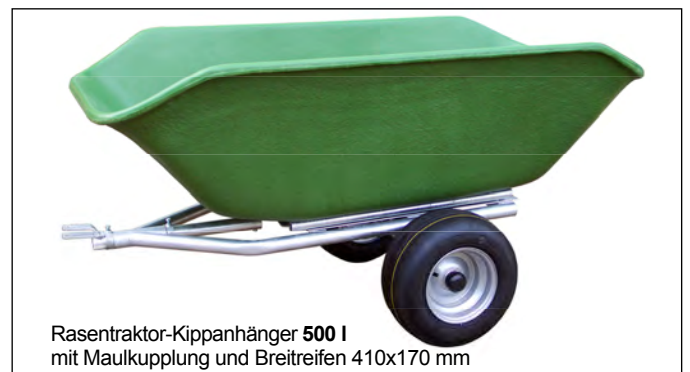
Rasentraktor-Kippanhänger 500 l mit Maulkupplung und Breitreifen 410x170 mm

Die Kippvorrichtung ermöglicht ein schnelles Entleeren des Anhängers. Der Aufsatz kann senkrecht gekippt werden, wodurch das Füllgut leicht herausfällt. Eine Feststellvorrichtung verhindert das ungewollte Zurückkippen der Wanne. Deichsellänge um 27 cm verstellbar. Kupplungshöhe von ca. 25 bis 45cm.