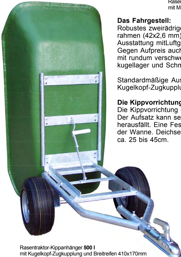
Rasentraktor-Kippanhänger 500 l mit Kugelpf-Zugkupplung und Breitreifen 410x170mm