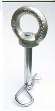
Anhänger-Bolzen für Maulkupplung (70x12mm mit Federstecker)