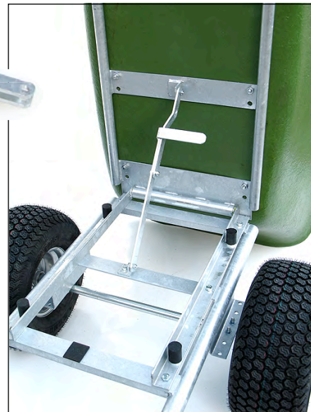
Kippvorrichtung mit Feststeller und Gummipuffern